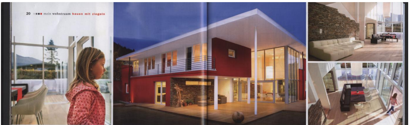
Rot und weiß sollt du sein: Ein eigenwilliges Wunschhaus für eine große Familie.

„Ich klammere Intuition aus und ersetze sie durch Methode, Funktionalität und Effizienz.“ Max Bill, 1908 - 1994, Künstler & Designer