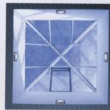
Eine Glaskuppel sorgt für viel natürliches Licht im Inneren des großzügigen Hauses, das bevorzugt mit Holz, Naturstein und Glaswänden ausgestattet ist.