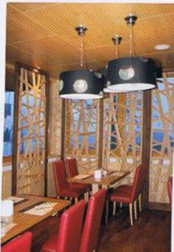
Für eigenwillige Strukturen sorgen im Restaurant Holzpaneele.