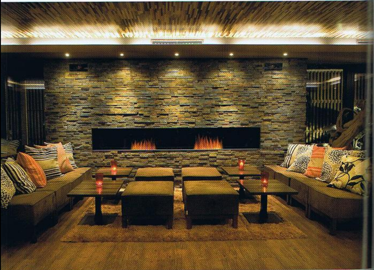
Rustikale Natürlichkeit mit kleinen Farbtupfern: Die Lounge lädt zum Plaudern ein.