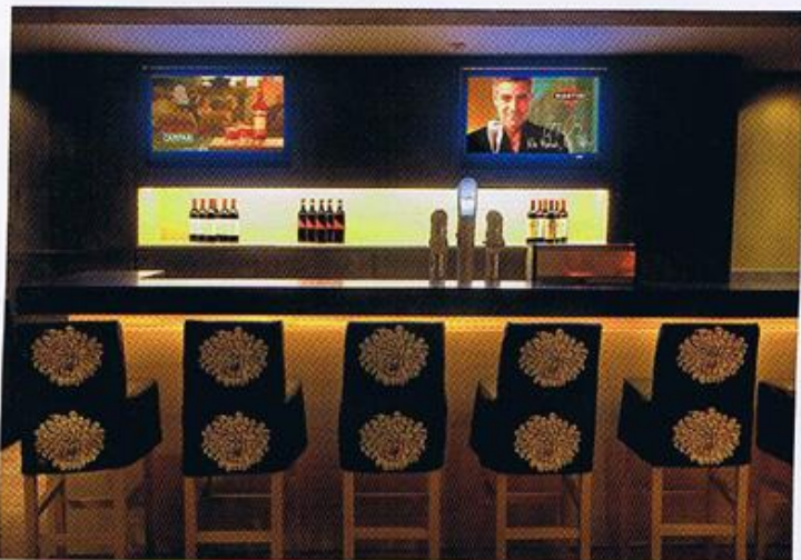
Zum Après-Ski an der Bar laufen aktuelle News auf dem Flatscreen.

gezeichnet hatte, stimmten zu Maes' Überraschung hundertprozentig mit dem überein, wie es hinterher tatsächlich aussah.